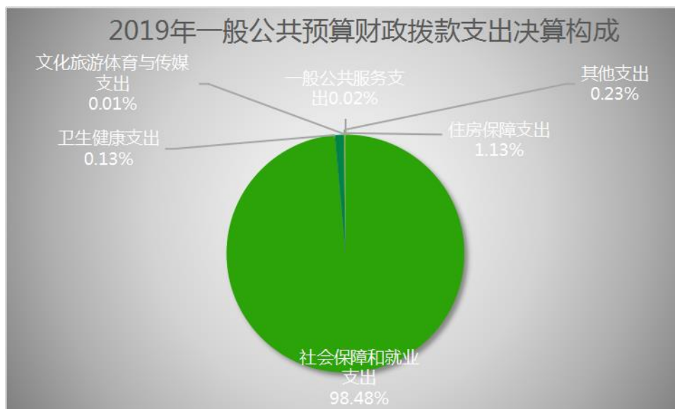
（一般公共预算财政拨款支出决算构成）

主要用于以下方面：一般公共服务支出(类)6.47 万元，占 0.02%；文化旅游体育与传媒支出（类）1.32 万元，占 0.01%；社会保障和就业支出（类）32758.36 万元，占 98.48%；卫生健康支出（类）42.62 万元，占 0.13%；住房保障支出(类)377.32 万元，占 1.13%；其他支出（类）76.74 万元，占 0.23%。