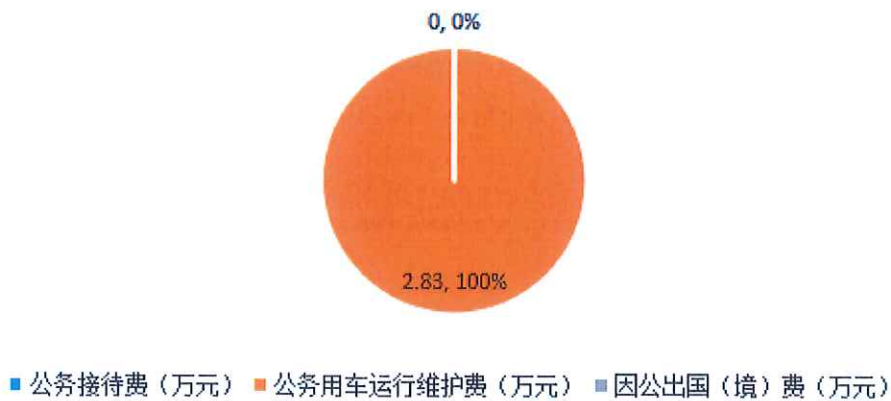
2014年与2015年“三公”经费支出决算对比表（图七）