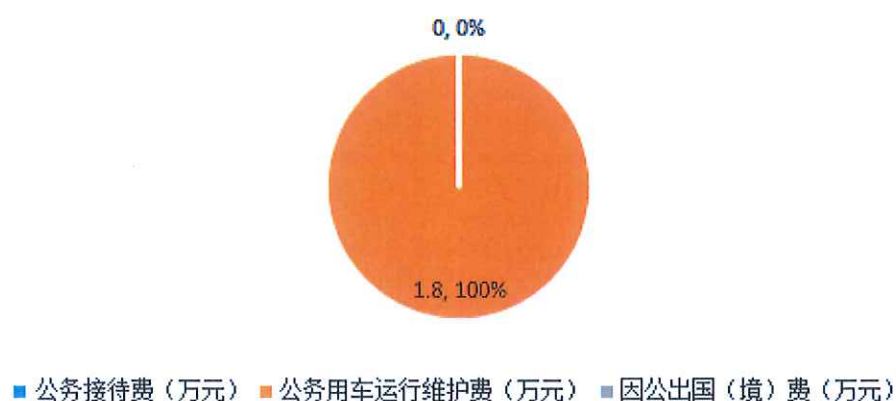
2015年与2016年“三公”经费支出决算对比表（图七）